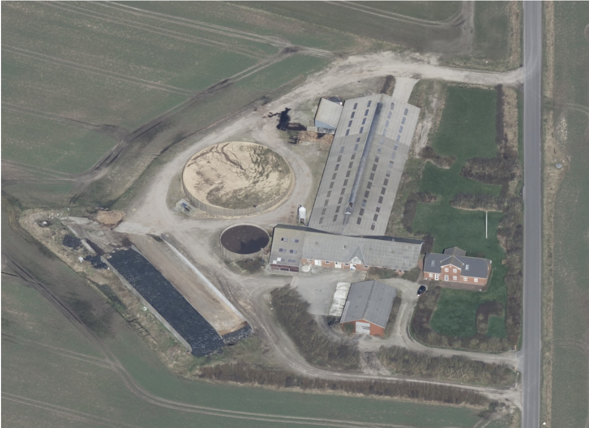
Skråfoto af Højgård, 2023.

Lemvig Kommune vurderer, at der kan etableres teltoverdækning på gyllebeholderen på Engbjergvej 78, 7620 Lemvig som anmeldt, uden forudgående tilladelse efter husdyrbrugloven.